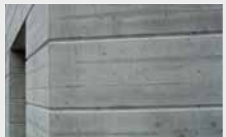
Verbesserte Optik bis ins Detail